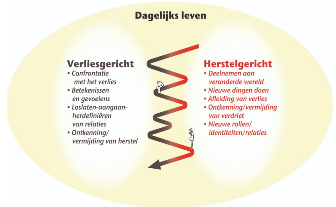
Duale Procesmodel van Omgaan met Verlies (Stroebe en Schut, 1999)